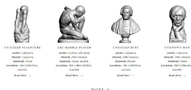
Lincoln 3d scans Gallery, The collections, Lincoln & Oliver Laric, 2012, screenshot home page, particolare, 2020.