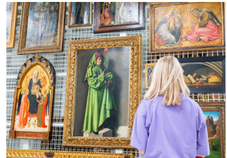
A sinistra. Il Depot Boijmans Van Beuningen di Rotterdam (foto di Ossip van Duivenbode, dal sito del Museo), 2021.