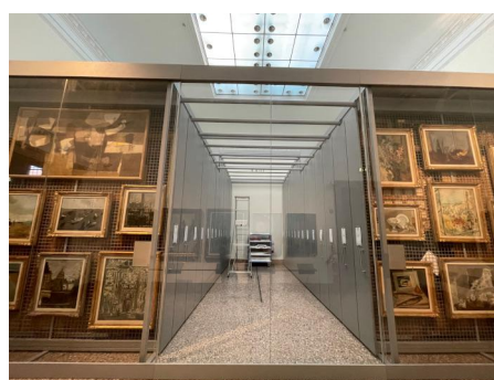
Uno dei depositi della Pinacoteca di Brera a Milano inseriti nel percorso di visita, completamente inaccessibile. Foto Daniela De Dominicis, 2021.

In Italia alcuni musei hanno recentemente reso accessibili i propri depositi, come per esempio la Galleria Borghese e La Galleria Nazionale di Roma, indicando precisi giorni di disponibilità. Ma in realtà hanno semplicemente ampliato il percorso di visita, alla Borghese questa sezione viene indicata come “una seconda pinacoteca (...) uno spazio (...) ordinato per scuole di pittura e per aree tematiche completo di tutti gli apparati espositivi” (17). La Pinacoteca di Brera a Milano ha inserito nel circuito visitabile alcune teche di deposito e un box per un laboratorio di restauro (18) ma si tratta di ambienti inaccessibili che si limitano a suggerire l'idea di un patrimonio presente ma inarrivabile.